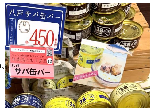
店頭販売のイメージ（赤いPOP）