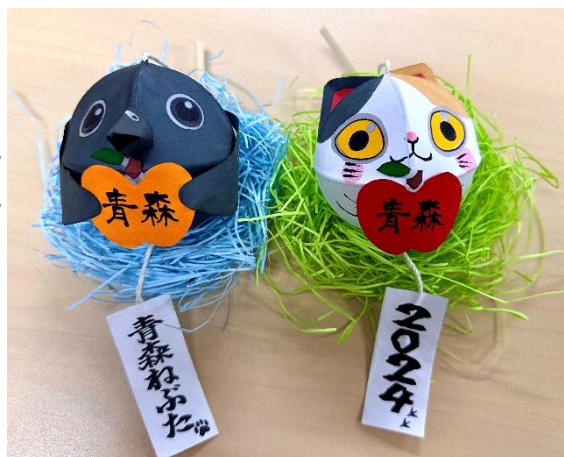
からすの金魚ねぶた（左）、ねこの金魚ねぶた（右）