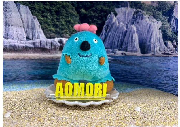
「仏ヶ浦」でのぬいぐるみ撮影イメージ