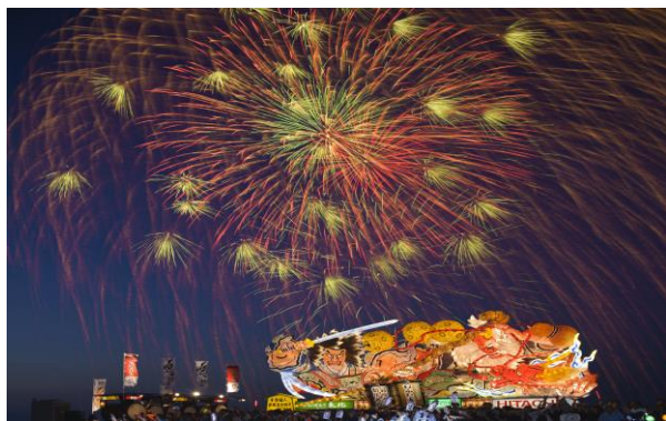
青森ねぶた祭のフィナーレを飾る ねぶたの海上運行と花火の競演