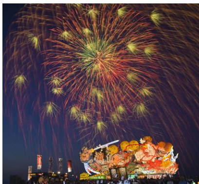
青森ねぶた祭のフィナーレを飾る ねぶたの海上運行と花火の競演