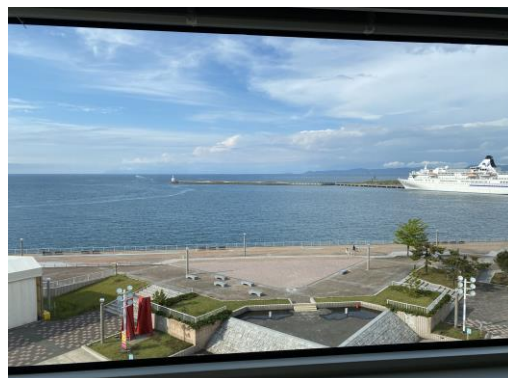
ねぶたと花火が間近で見れる アスパム4Fゆとりの空間

1) 概要 大切な人にぜひ見せてあげたい3年ぶりの「ねぶたと花火」 アスパムのゆとりの空間で楽しむ特製お弁当付きねぶた海上運行・花火鑑賞プラン