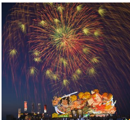
青森ねぶた祭のフィナーレを飾る ねぶたの海上運行と花火の競演