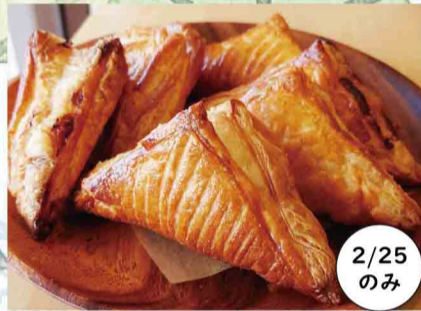
スロウ アップルパイ など