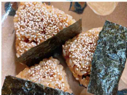
ふわふわの 平川サガリオおすび、 カワ子のりちゅぷりん など