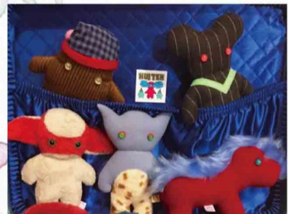
ぬい天 ぬい天のぬいぐるみや、 スウェット など