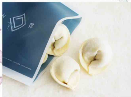
素のままproduct 回 回の冷凍水餃子 など