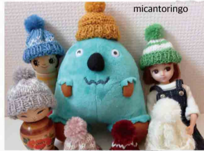
micantoringo ミニチュアニット帽 など