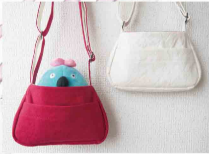
たにさわあい いくべえおでかけポシェット など