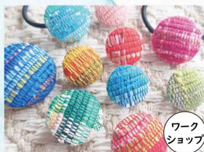
さきおりCHICKA 南部裂織 など