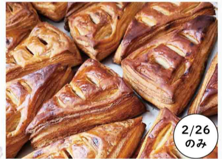
キズナベーカリー アスパム など