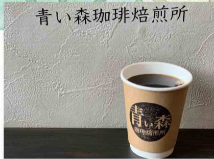
青い森珈琲焙煎所 自家焙煎コーヒー、スコーン など