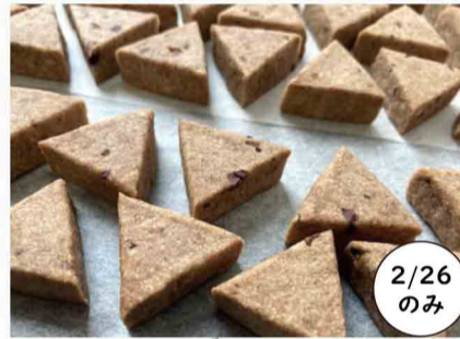
klich Vegan Cookie など