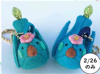
Everyday Gift いくべえ誕生日おめでとう！ な青い鳥ちゃん など