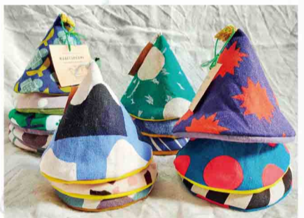
Jam さんかく鍋つかみ など