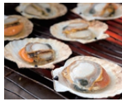
平内町水産商工観光課