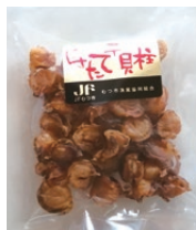
山海珍味販売しもかわ