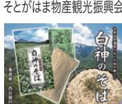
ブナの里白神公社