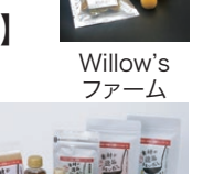
青森県だし活協議会