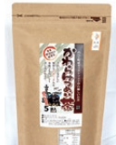
野辺地町観光協会