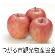
つがる市観光物産協会