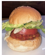
よもぎた物産館マルシェ