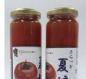
しちのへ観光協会