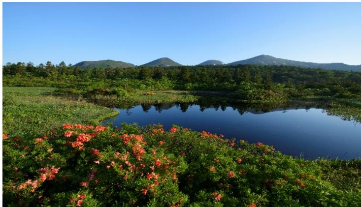
睡蓮沼 (イメージ・6月頃)