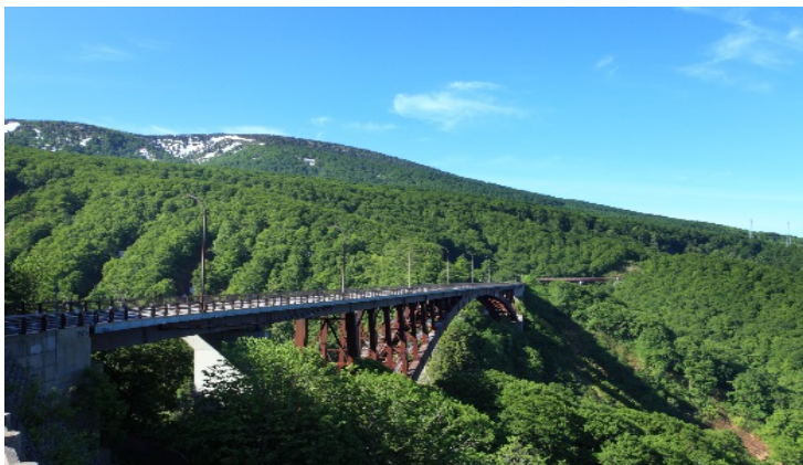
城ヶ倉大橋 (イメージ)