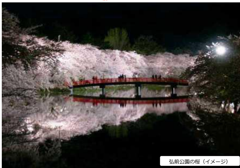
弘前公園の桜（イメージ）