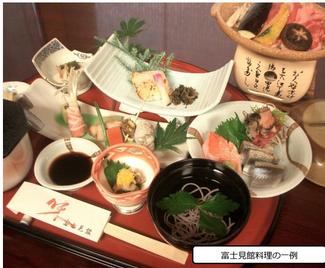
富士見館料理の一例