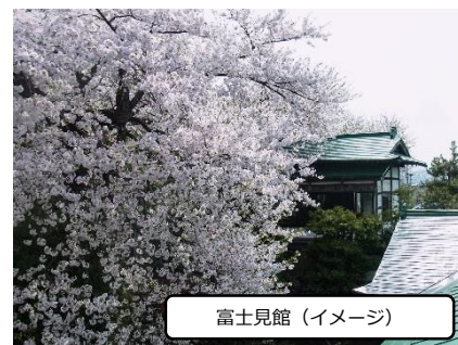
富士見館（イメージ）

○料亭富士見館…百年料亭「料亭 富士見館」は創業明治28年、木立に囲まれた閑静な料亭です。ご夕食は個室をご用意。建物は今も尚、百二十余年の歴史を感じさせます。この時期は、庭の桜も咲きほころびます。