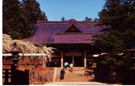
岩木山神社 (イメージ)