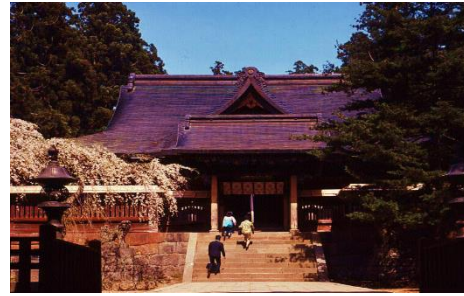
岩木山神社 (イメージ)