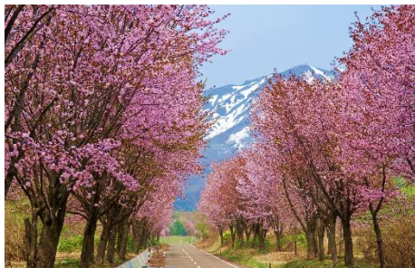
世界一長い桜並木 (イメージ)