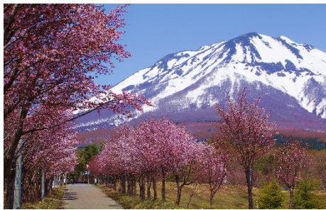
岩木山オオヤマザクラの並木 (イメージ)