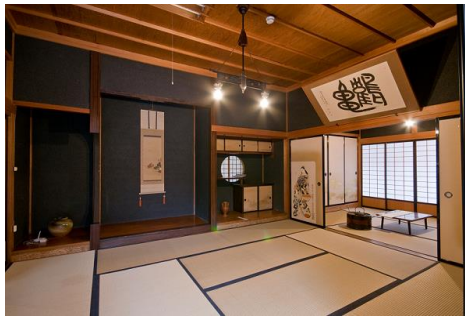
太宰が暮らした疎開の家「津島家新座敷」 （イメージ）