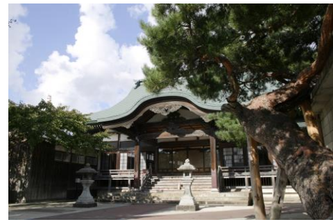
太宰思い出の寺「雲祥寺」（イメージ）