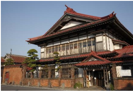
太宰の生家 斜陽館（イメージ）