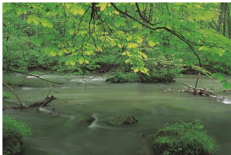
奥入瀬溪流 (イメージ)