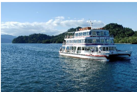
十和田湖 (イメージ)