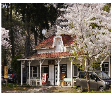
芦野公園駅舎（イメージ）