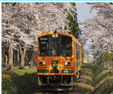
津軽鉄道（イメージ）