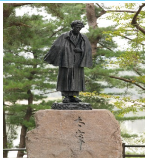
太宰治像（イメージ）