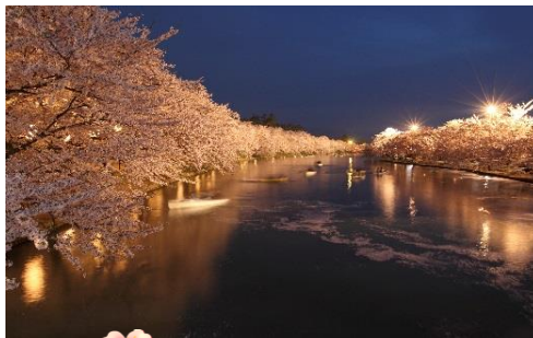
弘前公園のお濠 (イメージ)