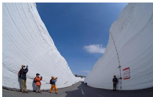
八甲田雪の回廊 (イメージ)