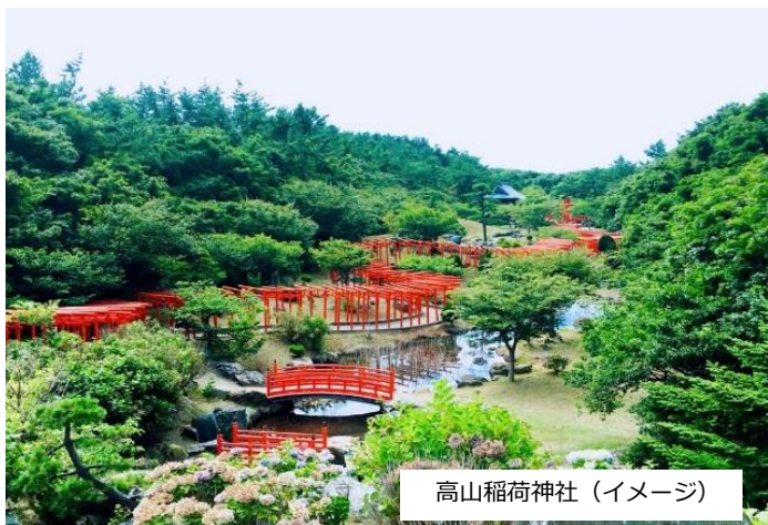
高山稲荷神社 (イメージ)