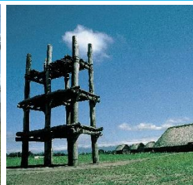
三内丸山遺跡 (イメージ)