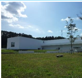
青森県立美術館 (イメージ)