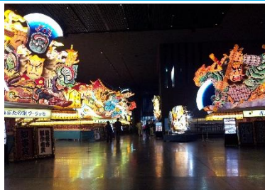
ワ・ラッセ (イメージ)