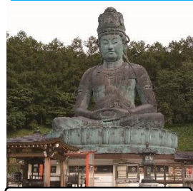
昭和大仏 青龍寺 (イメージ)