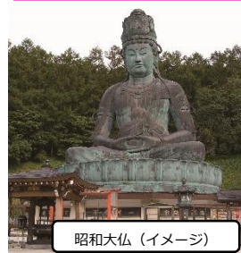
昭和大仏 (イメージ)