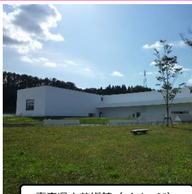
青森県立美術館 (イメージ)