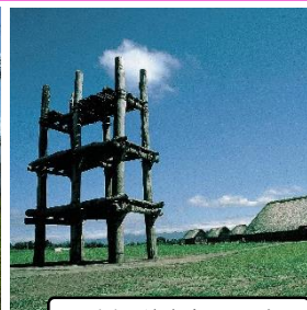
三内丸山遺跡 (イメージ)