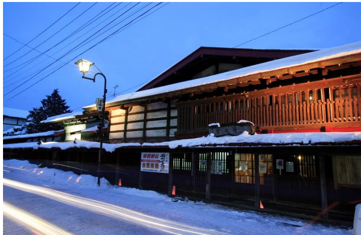
黒石中町こみせ通り（イメージ）