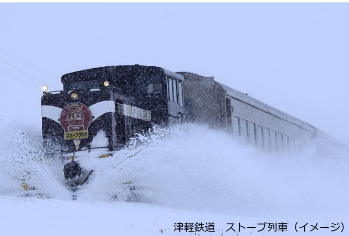
津軽鉄道 ストーブ列車 (イメージ)