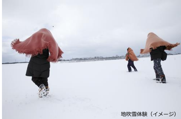
地吹雪体験 (イメージ)