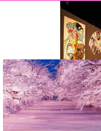
冬に咲くさくら (イメージ)