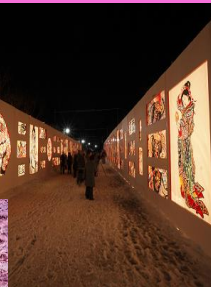
弘前城雪燈籠まつり (イメージ)