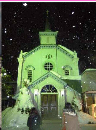
弘前市内 (イメージ)