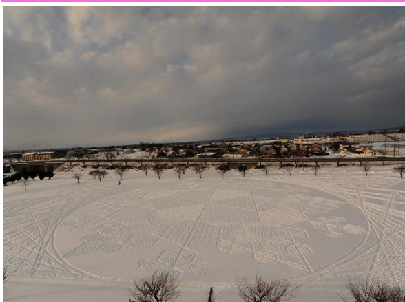
冬の田んぼアート (イメージ)