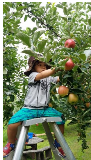
りんご園 (イメージ)