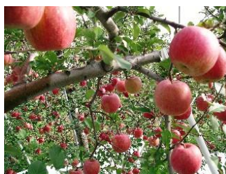
りんご園 (イメージ)