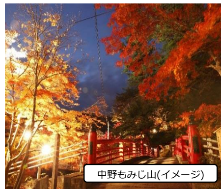
中野もみじ山(イメージ)