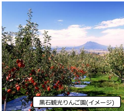
黒石観光りんご園(イメージ)