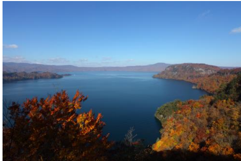
十和田湖 (イメージ)