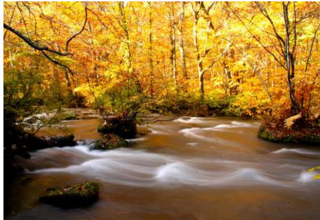
奥入瀬溪流 (イメージ)