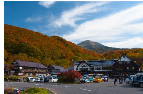
酸ヶ湯温泉 (イメージ)