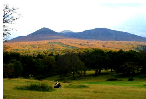
萱野高原（イメージ）