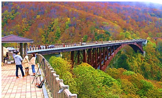
城ヶ倉大橋（イメージ）