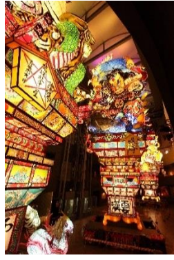
立佞武多の館（イメージ）