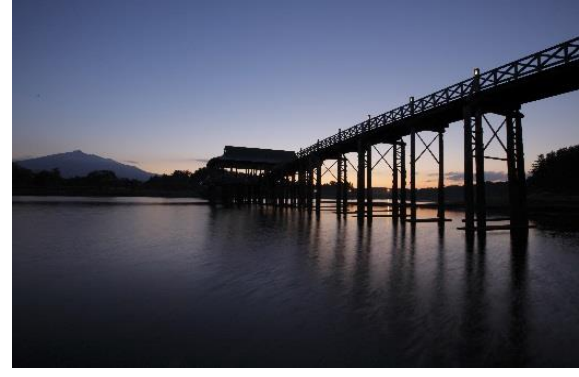
鶴の舞橋（イメージ）