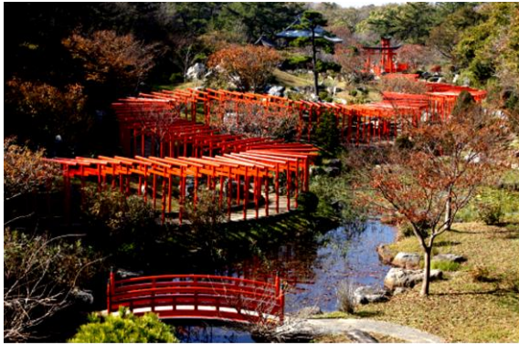
高山稲荷神社（イメージ）