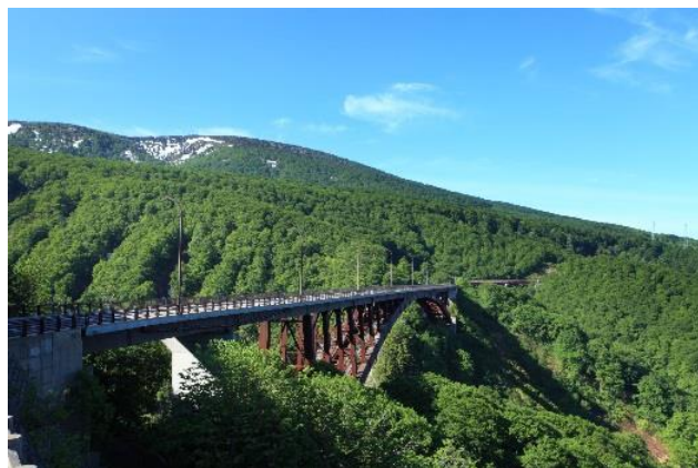
城ヶ倉大橋 (イメージ)