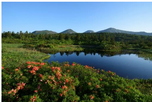
睡蓮沼 (イメージ・6月頃)