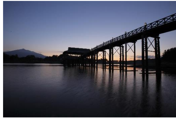
鶴の舞橋（イメージ）