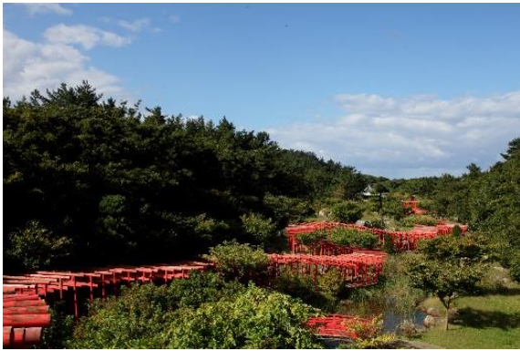
高山稲荷神社（イメージ）