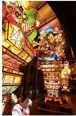
立佞武多の館（イメージ）